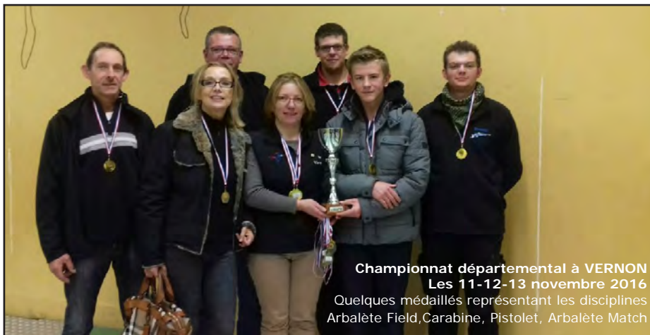
Championnat départemental à VERNON Les 11-12-13 novembre 2016 Quelques médaillés représentant les disciplines Arbalète Field, Carabine, Pistolet, Arbalète Match

Horaires et jours d'ouverture du stand de tir Mardi de 18h15 à 20h00. Mercredi de 18h15 à 20h00. Jeudi de 18h15 à 20h00 (Arbalète Field). Samedi Matin de 9h30 à 12h00 (Arbalète Field). Samedi après-midi de 14h00 à 18h30. Dimanche de 10h00 à 12h00, sur demande.